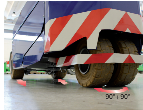
CONTRE ROTATION ET DIRECTION DES ROUES 90°+90°